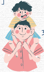
女兒 焯滿上 六月十九日