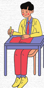
學生 焯基 六月十日